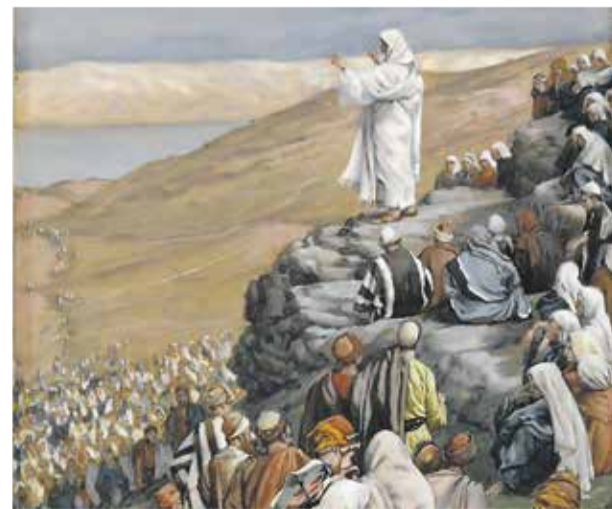
Le Sermon des Béatitudes, James Tissot, vers 1890