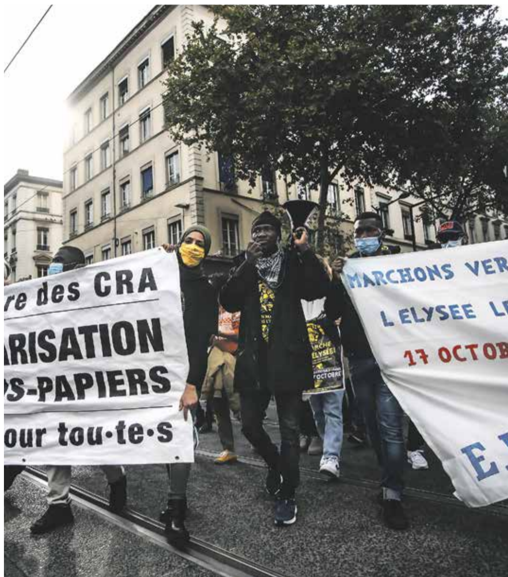
La marche des sans-papiers lors de son étape à Lyon, le 3 octobre

à l'accueil et la sécurité d'un Ehpad. Cet homme originaire du Sénégal a enchaîné les boulots depuis son arrivée en France en 2011. « J'ai commencé à travailler dans le nettoyage. Quand le patron découvre que tu es sans-papier, soit il te met dehors, soit il te promet de faire les démarches qu'il ne fait jamais. Quand je ne voyais pas la possibilité d'obtenir mes papiers, je changeais de patron. Maintenant je travaille dans l'accueil et la sécurité. »